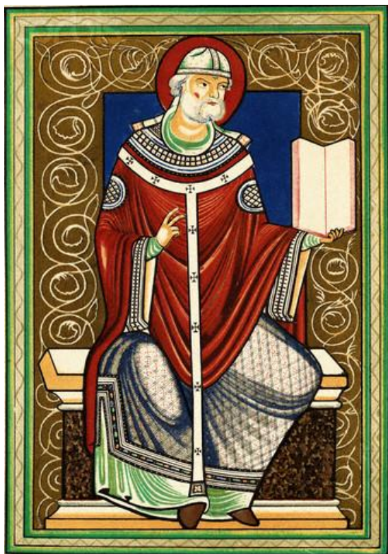
Pave Gregor den store

Det fantes kirkeklokker som handlet helt på egen hånd. Alle Romas kirkeklokker klang over denne byen da Gregorius den store ble valgt til pave i 590.