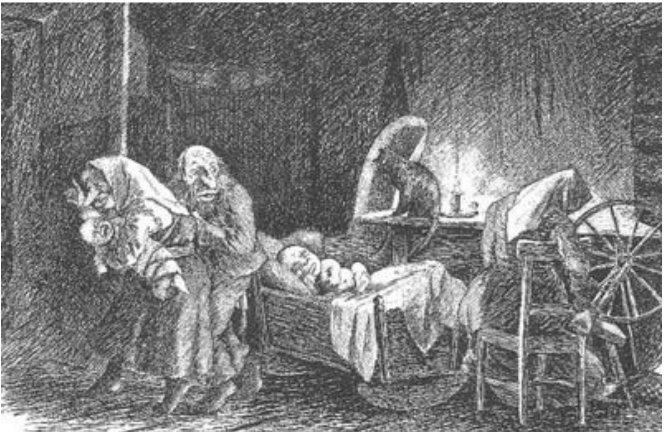
Theodor Kittelsen: De underjordiske

De underjordiske blir gjerne de som bærer skylden for at folk som ellers