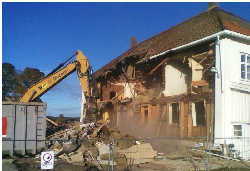
Nordli gård i Sørum under rivning

At Nordli gård i Sørum kommune ble revet i Kulturminneåret 2009 kan tyde på at kulturminnebegrepet er tømt for mening og derfor ikke har gjennomslagskraft i lokalpolitikk og i lokale plan- og bygningsprosesser. Kulturminneloven er ikke detaljert nok til å kunne fungere som verktøy for å forhindre slike hendelser – og vi kan spørre om refleksjonsgrunnlaget for bevisstgjøring om fortiden og hva som er verdt å ta vare på ikke også er manglende.