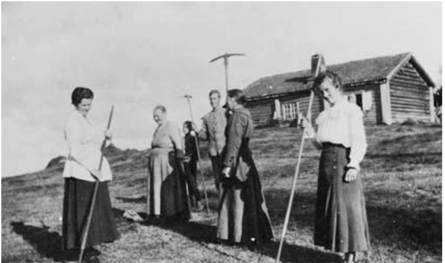
Fotografiet er fra Skalberget i Skogbygda i Løten. Skalberget var en av de største finneboplassene som nevnes i Finnemantallet.