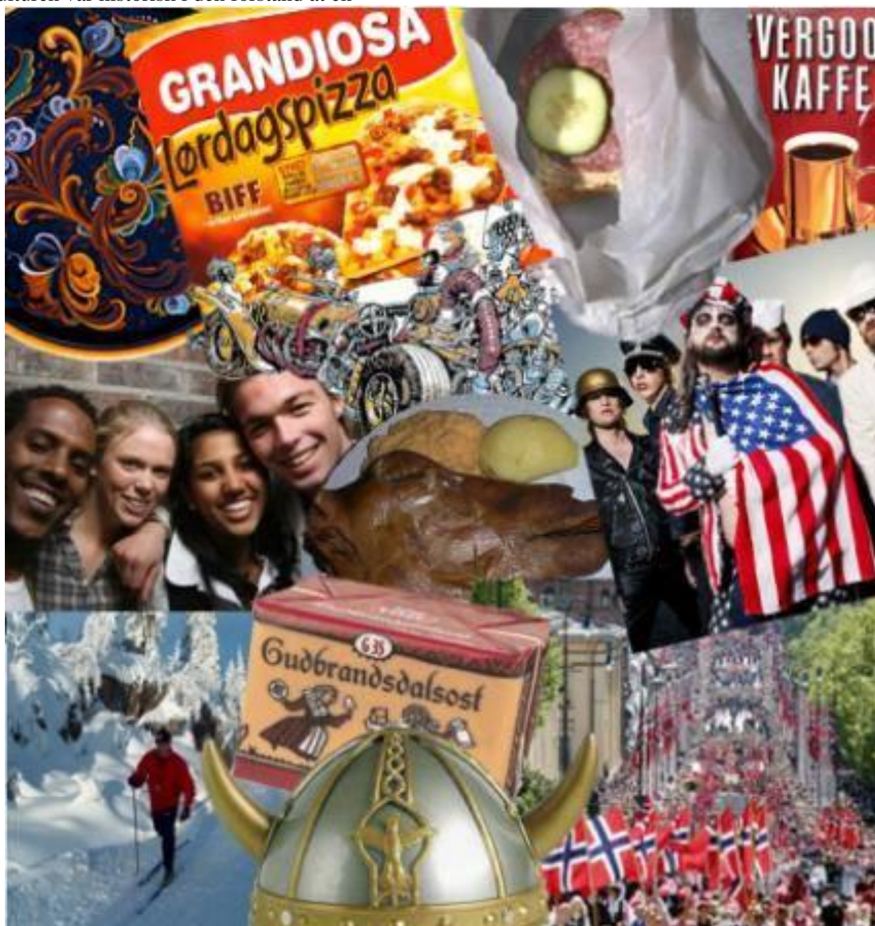
Plakat: Norsk kultur? Av Snorre Tørriseng

Oppbygningen av en selvstendig norsk nasjonalkultur kan grovt sett deles inn i tre forskjellige faser: Den grunnleggende fasen med basis i romantikk og nasjonalromantikk, den kulturpolitiske fasen og den nasjonalpolitiske fasen.