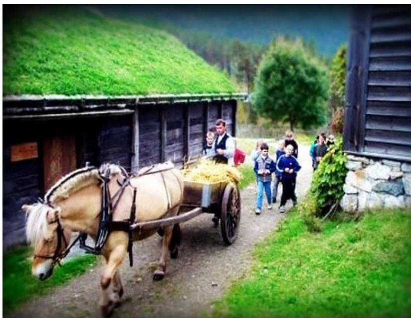
Pressefoto fra de

Vårt første skikkelige folkemuseum startet med Kong Oscar den IIs samling på Bygdøy. Utgangspunktet var Gol stavkirke som ble kjøpt i 1884 og det ble planlagt en gruppe hus rundt kirken for å skape et miljø. Samlingen på