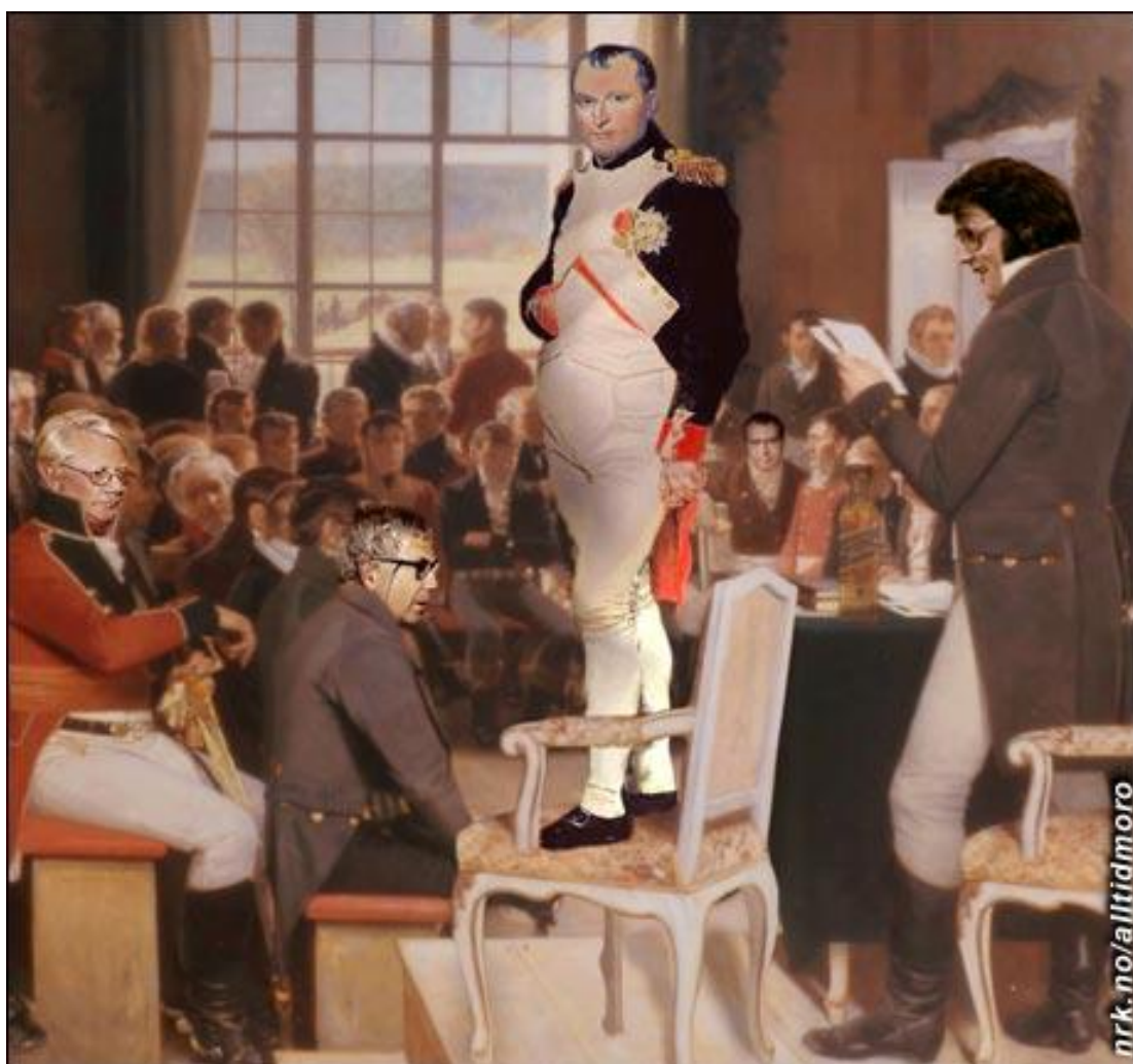
Parodi på O. A. Wergelands maleri av Eidsvoldsforsamlingen 1814, med Egil "Drillo" Olsen, Napoleon Bonaparte og Elvis Presley i sentrale posisjoner.

europiske land som søkte nasjonal selvstendighet. I og med at vi allerede hadde fått en grunnlov før løsrivelsen fra Danmark, var vi som stat å regne når vi gikk inn i unionsamarbeidet med Sverige. Den politiske reisingen for å skape enighet og begeistring for en egen nasjon var allerede unnagjort. Det eneste vi manglet var det kulturelle elementet som ville knytte den norske befolkning til nasjonalstaten Norge. Det enorme innsamlings- og formidlingsarbeidet som ble gjort gjennom på 18- og 1900-tallet frembrakte et usedvanlig sterkt resultat. For politikerne ble den norske nasjonalkulturen et kraftfullt redskap i kampen om å løsrive Norge fra andre stater.